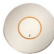
PULSANTE WIRELESS FEB AIR

Il kit udienza 3 MODULI è un semplice KIT semaforico, alla portata di tutti, sia come cablaggio che realizzazione, utile per dare indicazione a chi chiede udienza di sapere se accedere o meno in una stanza o qualsivoglia luogo. E' composto da 3 moduli con la scritta AVANTI: il modulo diventa verde quando viene premuto il PULSANTE WIRELESS, altrimenti tutto rimane spento. Fa parte della domotica FEB AIR, il kit viene venduto già programmato. Non necessita di alcun cablaggio, il pulsante può essere posizionato dove si vuole basta che sia nel raggio di 10mt dal RELÈ SMART art. 9421.