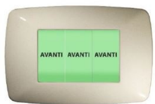
SEGNALAZIONE AVANTI ACCESA