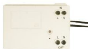
MODULO RELE' SMART